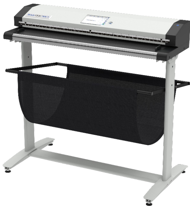
Soporte WT36 con canastilla para papel

La canastilla para recibir el papel se puede montar a tres alturas diferentes sin necesidad de usar herramientas especiales. Además, se puede montar descentrado para permitir un área de entrada mayor por la parte posterior o frontal del escáner.