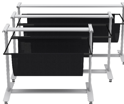
Tres diferentes soportes para todos los escáneres WideTEK de hoja suelta.