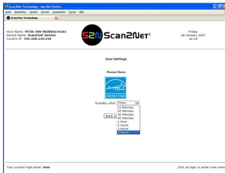
Abbildung 3: Auswahl der Abschaltzeit

Klicken Sie in der Zeile S2N Base Settings auf User , um den nächsten Bildschirm zu öffnen. Der Umfang des angezeigten Bildschirmhalte kann je nach Scannermodell unterschiedlich sein.