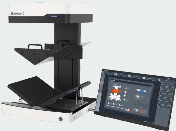
El Bookeye® 5 V3A automático con base en forma de V y placa de vidrio.

La placa de vidrio en forma de V se controla a través de la interfaz de usuario extendida de ScanWizard. El nuevo panel de control con botones de función animada permite, entre otras cosas, el movimiento horizontal hacia arriba y hacia abajo, ajustando la velocidad o la posición en la que permanece la placa de vidrio después del trabajo de escaneo terminado. No necesariamente tiene que estar en la parte superior o inferior. Dependiendo de los requisitos, la placa de vidrio se puede quitar y volver a colocar sin herramientas y en dos simples pasos.