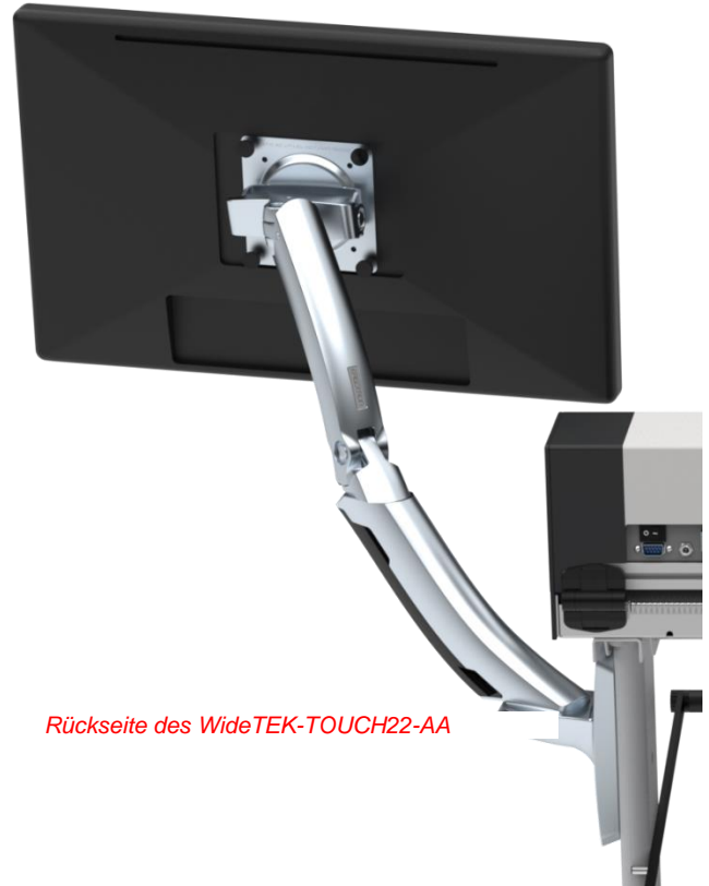
Rückseite des WideTEK-TOUCH22-AA