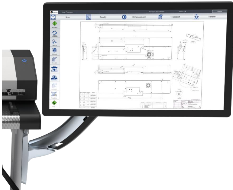
Monitor HD con brazo ajustable montado al costado de un WT36 / 48 / 60-STAND

Utilice la pantalla táctil con versiones mejoradas de ScanWizard, PrintWizard y EasyScan, con el firmware Scan2Net.