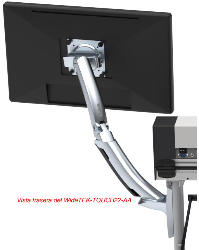
Vista trasera del WideTEK-TOUCH22-AA