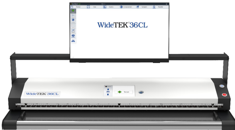
Touchscreen auf einem WT36CL - in zentraler Position montiert

Kein PC wird benötigt, alles kann über den Touchscreen erledigt werden, einschließlich des Versendens von Bildern über das Netzwerk an ein beliebiges Ziel in der Welt. Mit der integrierten ScanWizard-Funktionalität können Sie den Scanner und seine Einstellungen verwalten, zoomen und eine Vorschau Ihrer gescannten Bilder anzeigen, um höchste Qualität und Produktivität zu gewährleisten.