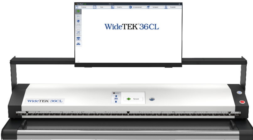
Pantalla táctil en un WT36CL montado en la posición central

No se necesita PC, todo se puede realizar desde la pantalla táctil, inclusive el envío de imágenes a través de la red, a cualquier destino en el mundo. Con la funcionalidad total de ScanWizard, administre el escáner y su configuración, y revise sus imágenes escaneadas de ser necesario, para la mayor garantía de calidad y la mejor productividad.